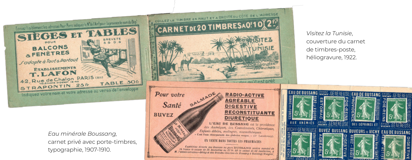
Eau minérale Bussang, carnet privé avec porte-timbres, typographie, 1907-1910.

De nombreuses maquettes originales d'artistes seront dévoilées pour la première fois au public. L'exposition est aussi l'occasion pour le Musée de La Poste de valoriser l'acquisition faite en 2011 d'un ensemble de 200 carnets de timbres datant du début du XX e siècle. Cette exposition propose une histoire vivante, mettant en évidence les liens profonds entre l'univers postal, la société française et les évolutions culturelles au fil du temps.