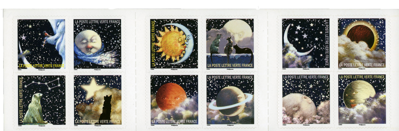
Guy Coda, Correspondances planétaires, carnet de timbres-poste, héliogravure, 2016

À partir de 1985 de nouvelles séries thématiques voient le jour : les personnages célèbres, la journée du timbre, ainsi que les carnets « à messages » qui prennent de plus en plus d'importance. La Poste fait appel à des peintres, dessinateurs, street artistes ou illustrateurs de bandes dessinées. Le geste de l'artiste prime dorénavant et se concilie avec l'utilité de cet objet cher aux Français.